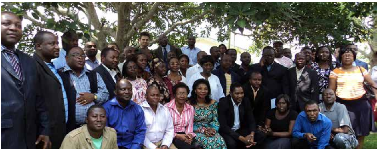
Photo de famille de la création de la plate forme nationale REDD et CC

La plateforme a des démembrements aux niveaux régionaux et communaux (en cours de mise en place. Sur 30 membres que comptent les coordinations régionales 10 sont des femmes dont 9 sont du REFACOF), et a des groupes thématiques et des niches d'intervention. Elle a identifié neuf groupes d'acteurs comme cibles de ses actions: (i) ses propres membres; (ii) les femmes; (iii) les Peuples autochtones; (iv) les communautés locales; (v) les chefs traditionnels, (vi) les Maires et aux autres élus du peuple et élus locaux; (vii) les jeunes; (viii) les autres partenaires de terrain (personnels techniques de l'Etat, petits artisans/utilisateurs du secteur bois/bois énergie, autres acteurs du secteur privé, etc.) et (ix) les promoteurs de projets.