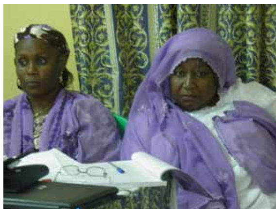
Les femmes peuls Coordinatrices régionales de la PFN REDD et CC