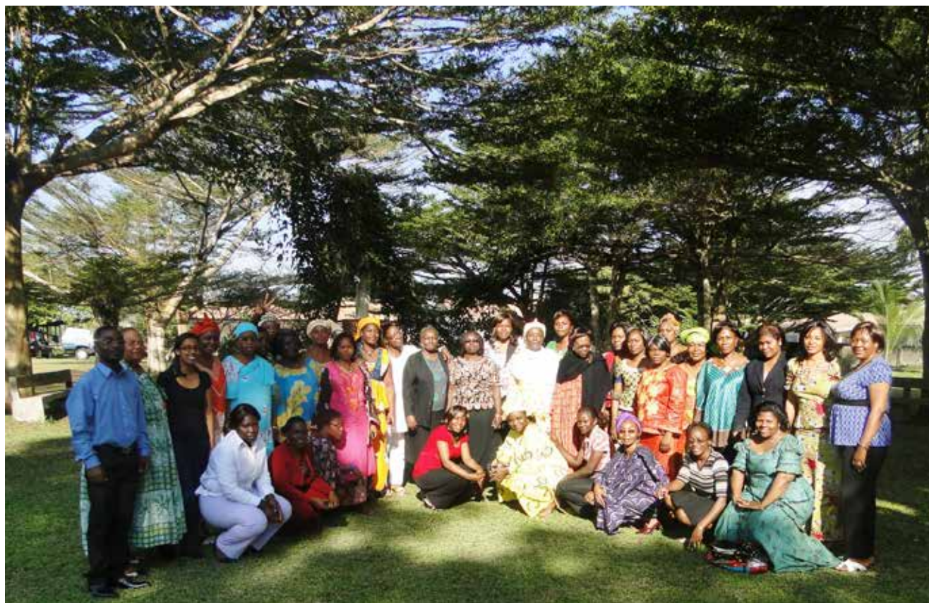
Les femmes de la Société Civile du Cameroun à l'atelier de formation d'intégration genre dans le processus REDD