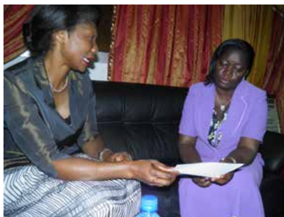
La présidente du REFACOF en plein entretien avec la Ministre de la promotion de la femme du Burkina

Sous réserve des limites ci-avant évoquées concernant les difficultés que rencontre le Cameroun à la mise en œuvre des politiques et des législations, cette adhésion aux textes internationaux n'est pas du tout inutile pour le REFACOF. Elle constitue bien une garantie forte pour la reconnaissance et la protection des droits des femmes au Cameroun, eu égard au contenu des textes internationaux pertinents, à leur nature juridique et à l'existence de systèmes de suivi et de contrôle de la bonne mise en œuvre des obligations, voire de sanction.