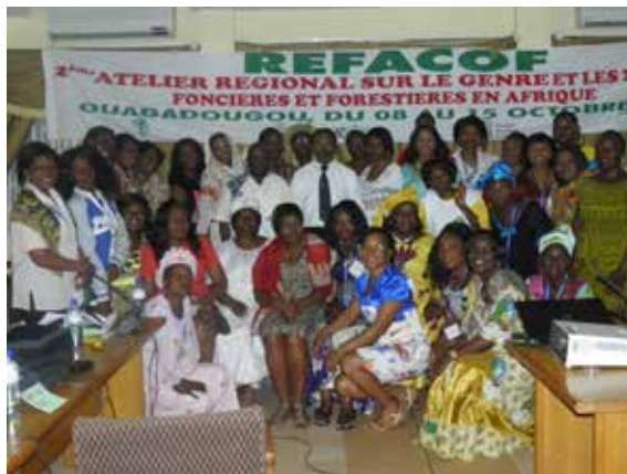
Photo de famille de l’Assemblée générale

Le Réseau des Femmes Africaines pour la gestion Communautaire des Forêts (REFACOF) 1 est né en 2009 du constat fait par des femmes issues de différents pays d’Afrique de l’Ouest (Burkina Faso, Nigeria, Sénégal) et du centre (Burundi, Cameroun, Gabon, RCA, RDC) de la persistance d’une grave situation de discrimination à leur encontre dans le monde rural, spécialement en ce qui concerne l’accès et la gestion des terres et des forêts 2 . Constituant aujourd’hui une “plateforme spécialisée” 3 de membres ressortissant de très nombreux pays d’Afrique Centrale et Occidentale et Madagascar 4 , le REFACOF s’est dès sa création donné pour mission “de promouvoir les droits des femmes en Afrique et d’influencer les politiques et les pratiques pour une équité de genre en matière de tenure foncière et forestière” 56 . A cette fin, il mobilise ou revendique valablement divers réformes et outils: agrégation et approfondissement de données statistiques, recueil et analyse des réglementations, renforcement des capacités de réflexion et de revendication, etc. L’étude attentive de toutes ces actions met en évidence les insuffisances présentes du REFACOF et trace ainsi la voie de sa stratégie à venir.